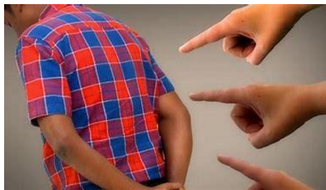
Illustration article « Boucs émissaires » revue-passages.fr

L'objectif des dirigeants du système est de cacher leur propre responsabilité en propageant le racisme et la xénophobie, en attisant les divisions entre les adeptes des différentes religions, en culpabilisant les victimes de leur politique destructrice. Pire, ils en tirent prétexte pour renforcer la fascisation du système en adoptant des lois liberticides soi-disant à des fins sécuritaires.