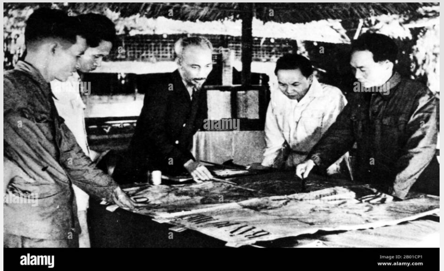
Ho Chi Minh et le Général Vo Nguyen Giap aux commandes

La bataille de Diên Biên Phu a débuté le 13 mars 1954. Elle opposait l'armée française aux forces Viêt Minh et s'est achevée le 8 mai 1954 par la défaite des colonialistes. L'événement a ébranlé le monde et galvanisé tous les Peuples en lutte pour leur libération. Qu'est-ce qui explique cet exploit des combattants vietnamiens ?