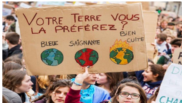
Manifestation de militants de la CGT

Les catastrophes meurtrières liées au dérèglement climatique se multiplient. L'écrasante majorité des scientifiques alertent sur l'urgence de mettre en œuvre des mesures radicales pour que le point de non-retour ne soit pas atteint. Mais pas question pour les multinationales d'accepter que leurs profits baissent ! Alors ils dépêchent leurs mercenaires pour faire barrage à l'application des dispositions prises pour lutter contre l'écocide.